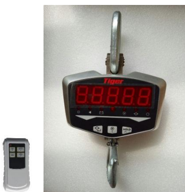
TCS - 01 พิกัด 300 กก.