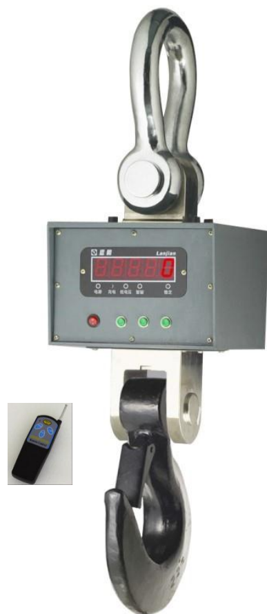
TCB - 01 พิกัด 20 และ 30 ตัน