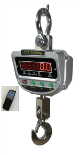
TC - 01 พิกัด 600 กก. - 15 ตัน