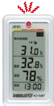
(熱中症指数の表示例)