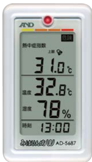
(熱中症指数の表示例)