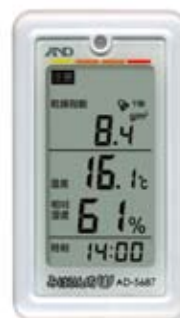
(乾燥指数の表示例)