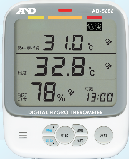
(熱中症指数の表示例)