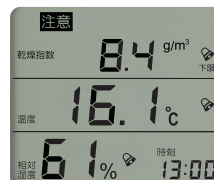
(乾燥指数の表示例)